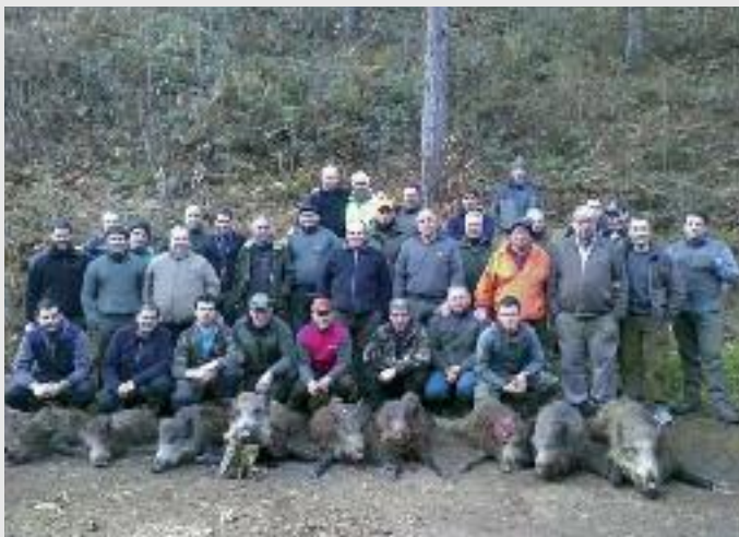
Talde lana oso garrantzitsua da basurde ehizan

Hogeita bost bat urte dira Oñatin basurde ehiza modu antolatuan eta kontrolatuan egiten hasi zela. Gaur egun bost kuadrilla aritzen dira, bi taldetan banatuta; 75 bat lagun guztira. Irailean hasi eta apirilera arte asteburu eta jai egun guztietan egiten dituzte ehizaldiak, diputazioaren baimenarekin. Hamabost bat lagun bildu ohi dira. Goizeko 8ak aldera abiatzen dira, txakurrak lagun, basurdeen arrastoei (usaina, hanka markak, ileak...) segika. Basurdea antzematen dutenean, gunea inguratu eta txakurrak askatzen dituzte basurdeari ezkutalekutik irtenarazi eta tiroa jaurtitzeko. Talde lana oso garrantzitsua da ehiza mota honetan, eta segurtasun neurriak zaintzea ere bai. Basoa ondo ezagutzera ere oso inportantea da, eta txakurrak ondo erakutsita edukitzea era bai. Horrek aurretiazko lan handia eskatzen du. Basurdea harrapatu ondoren, gibela, birrikak eta narrua analizatzera bidali behar izaten dute. Okelarekin tarteka afariak egiten dituzte, baina, batez ere, txorizoak eta hanburgesak egiteko erabiltzen dute gaur egun.