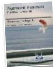
Saiakera "Generación líquida"