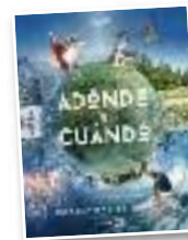
Bidai liburua "A dónde y cuando"