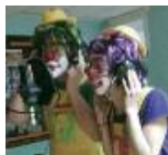
Potx eta Lotx