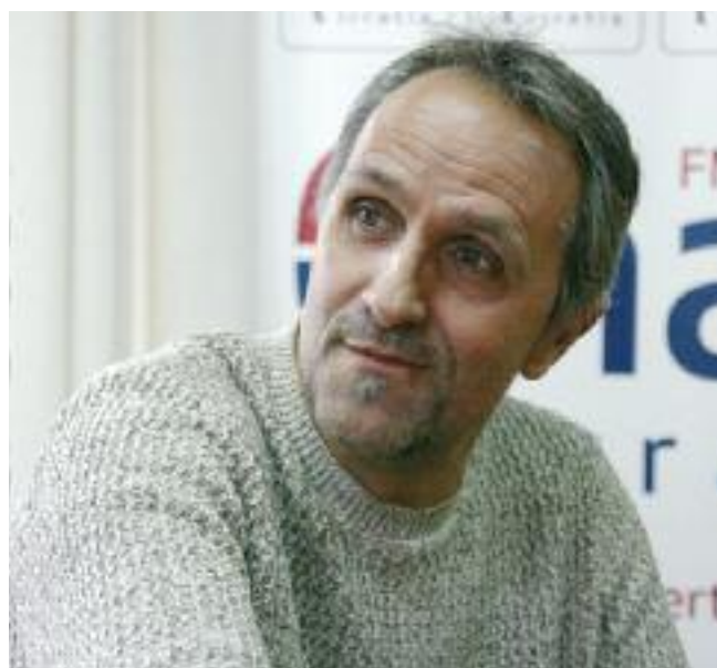
Odroizola pozik, taldea lehen mailara ekartzea lortu dutelako.

Etorkizuna nola ikusten duzu?. Gorago iristeko lan egingo duzula esan izan duzu.