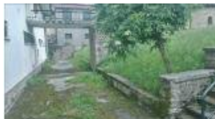
> Auzo etxetik jolaslekura dagoen desnibela gairatzeko arrapala egokituko da