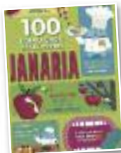
Haur liburua "100 kontu ondo..."