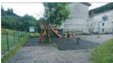
> Jolas parkeko zoria berriitu eta pittin bat desplazatu egingo da

Horretarako, auzo-etxea eta jolaslekuaren artean dagoen desnibela gairatzeko arrapala bat egokituko da, eta auzo-etxekeo sarrera ere irisgarri bihurtuko da, bertan dauden bi