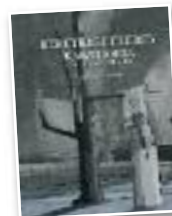
Komikia "Bereterretxeren kanthoria"