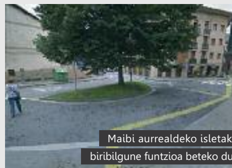
Maibi aurrealdeko isletak biribilgune funtzioa beteko du

Lan orduetatik kanpora (18:00- 8:00) eta asteburuetan zabalik egongo da Bakardadeko Ama kalea. Portu kaletik gorako trafikoari oraingoz ez dio eragingo obrak. Lanak bi hilabetez luzatuko direla aurreikusten da.