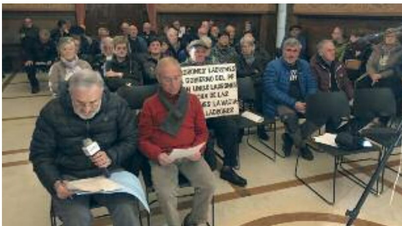
Apirilaren 16tik aurrera pentsiodunek elkarretaratzeak egiten jarraituko dute plazan (12:00)