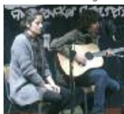
Valls eta Izar