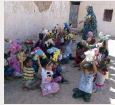
Kanpalekuetako haurrak Oñatitik bidalitako jostailu eta eskola nahiz kirol materialarekin