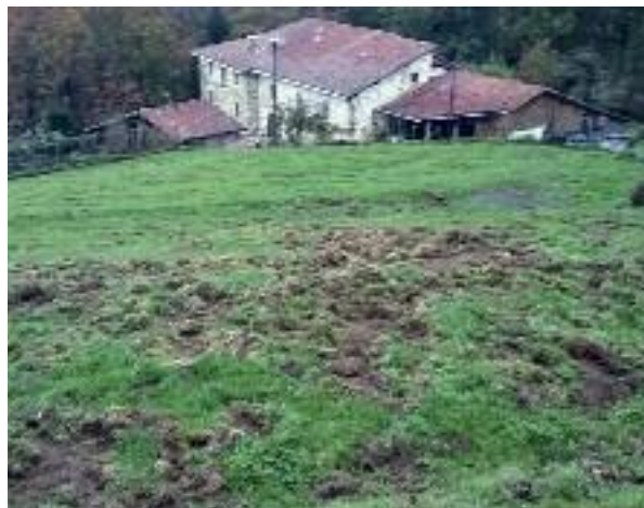
Ondoko argazkietan ikusten den moduan kalte handiak eragiten dituzte basurdeek belardietan

ostegunetan ere ehizatzeo baimena ematen hasi zen iaz diputazioa.