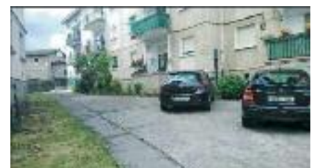
> 35-38 etxeen inguruko zoladura berriitu eta aparkalekuak ordenatuko dira